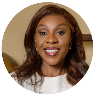
JUDICAËLLE OKEMBA General Commissioner