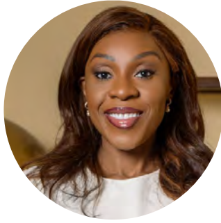
JUDICAËLLE OKEMBA General Commissioner